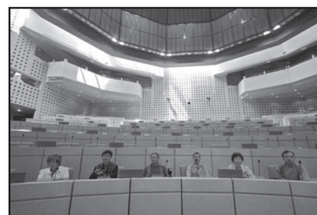
Conseil regional des Pays de Loire