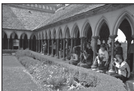
Mont Saint Michel