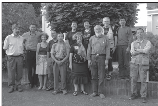
Local group ISF of Thouaré sur Loire with our guests Groupe ISF de Thouaré s/L. avec nos invités