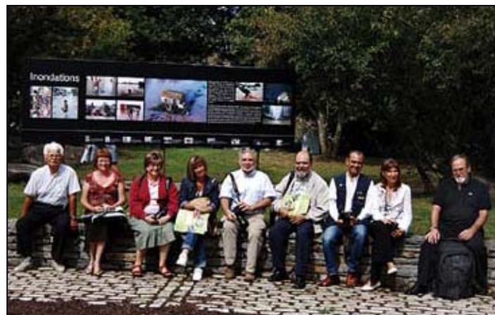
Les membres ISF de Barcelone (Espagne) août 2007 / ISF members of Spain (Barcelona) in La Gacilly August 2007

See pictures of La Gacilly's 2007 photo boards.