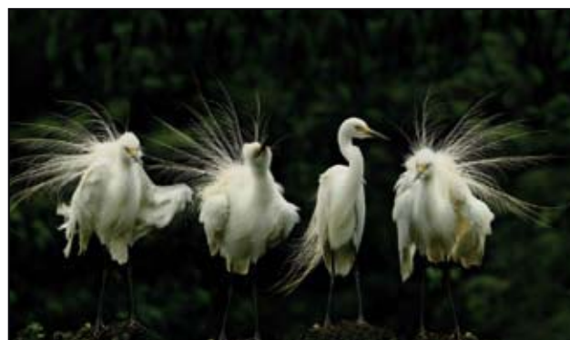
Photos de l'exposition «Hérons» du collectif chinois de Lishui / Lishui chinese group photographs