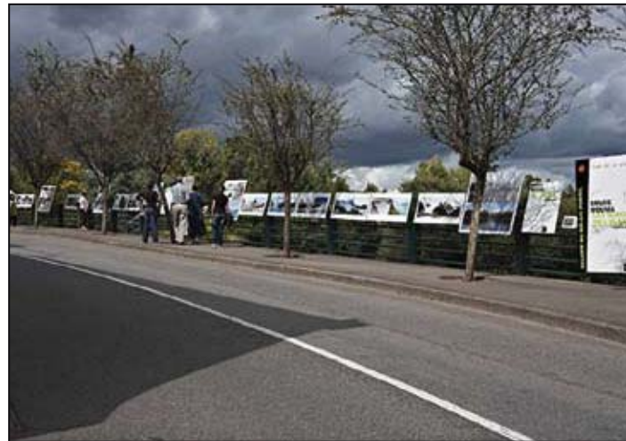
En images les panneaux 2007 de photographies de la Gacilly / La Gacilly 's photos boards (2007)

Tous les Auteurs ayant fait parvenir des photos auront la possibilité de télécharger un cd-rom à partir du site: www.image-sans-frontiere.com sur une adresse qui leur sera communiquée par le Webmaster.