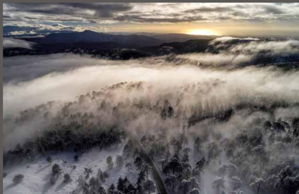
Romos Kotsonis - Mysti forest