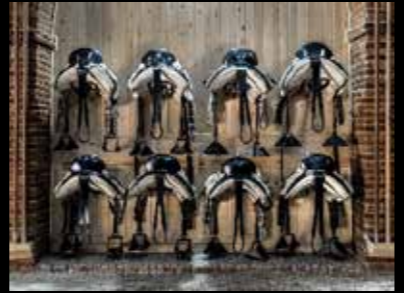
Alain Paille - Royal Horses