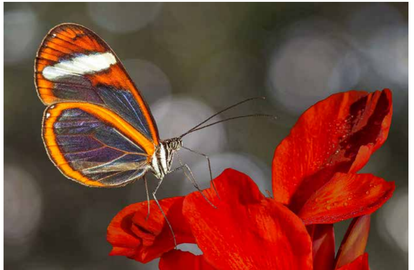
Greta oto (Costa Rica)