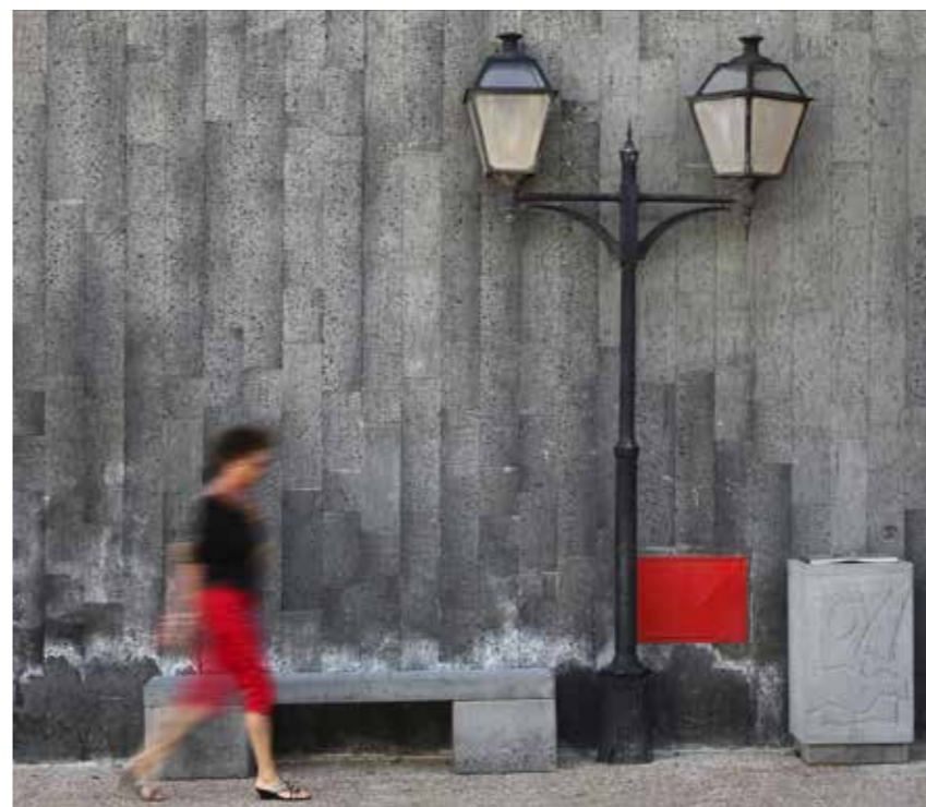
Nils-Erik Jerlemar - Black and Red