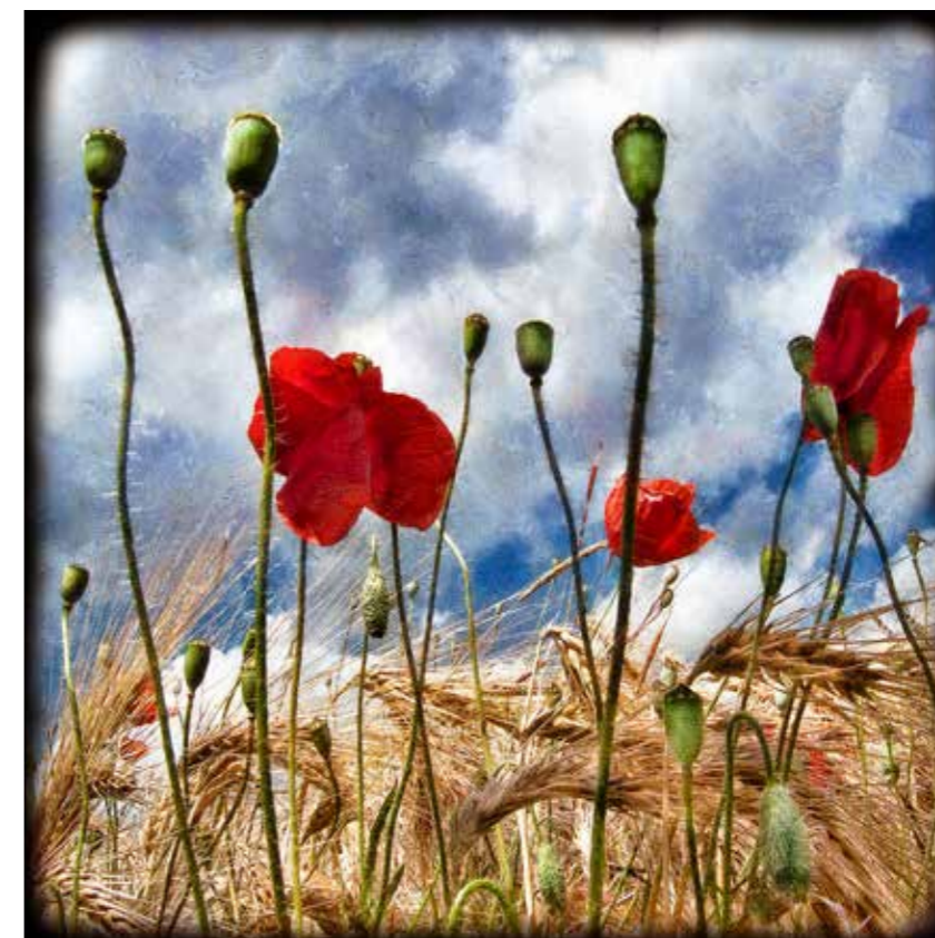
Michel Gilliot Les coquelicots