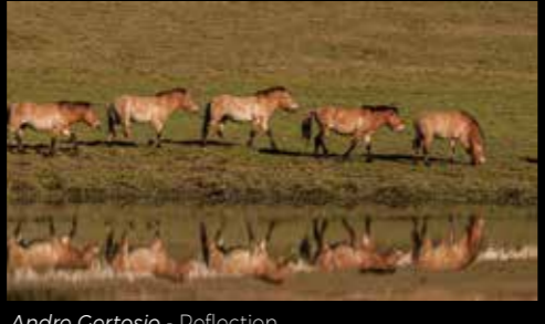
Andre Gertosio - Reflection