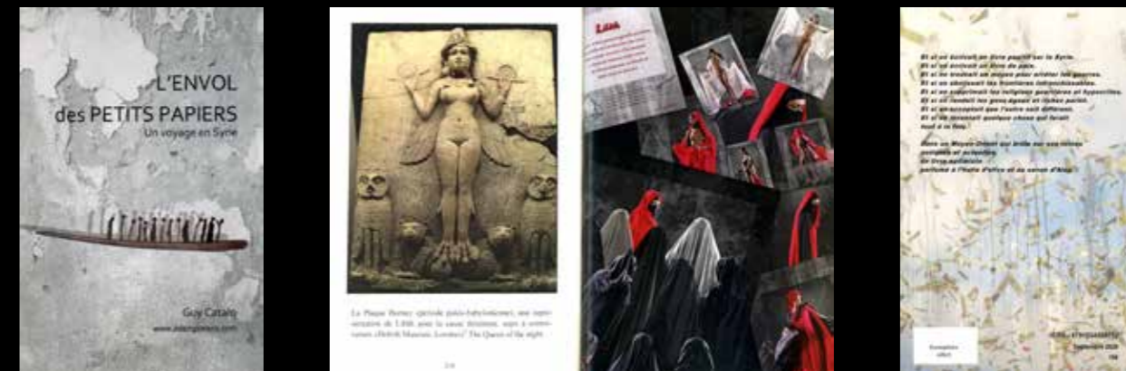
Illustration de Monique Corriol , d'une partie du livre de Nouvelles, en faveur de la paix en Syrie, de Guy Catalo , (responsable des chemins de photos) : L'Envol des Petits Papiers