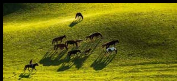
Gunther Riehle - Tekesi is horse