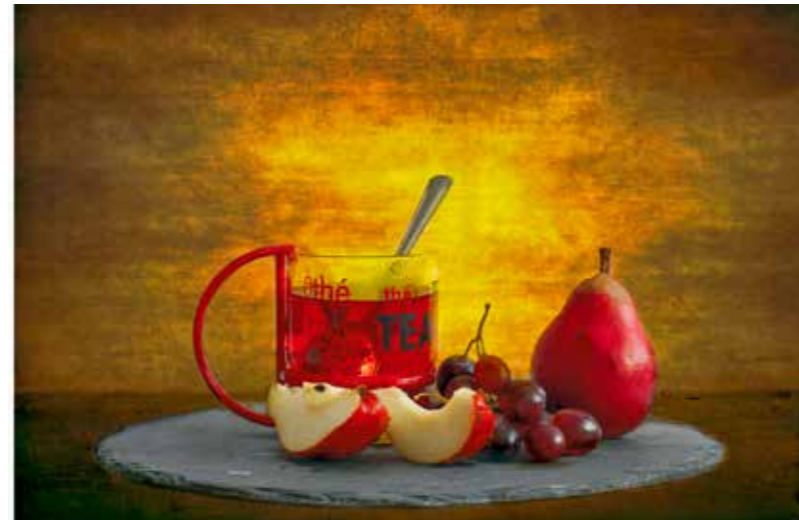
Tea and fruits