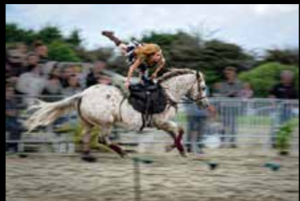
Sylvie Tachot Goavec - Celtic Dance