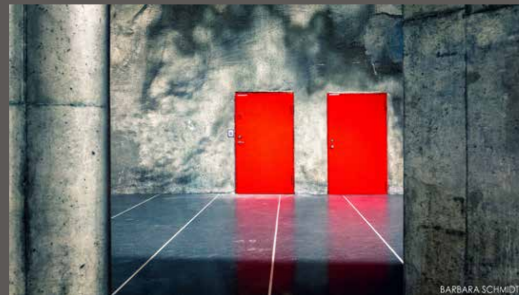
Barbara Schmidt 2 red doors