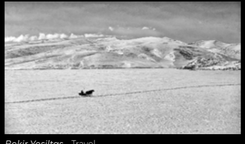
Bekir Yesiltas - Travel