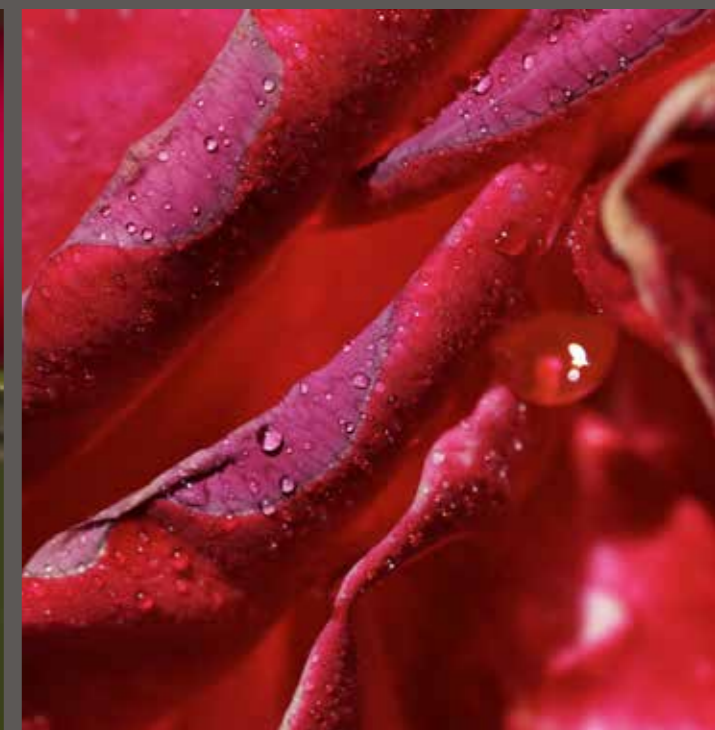
Monique Corriol - Rose