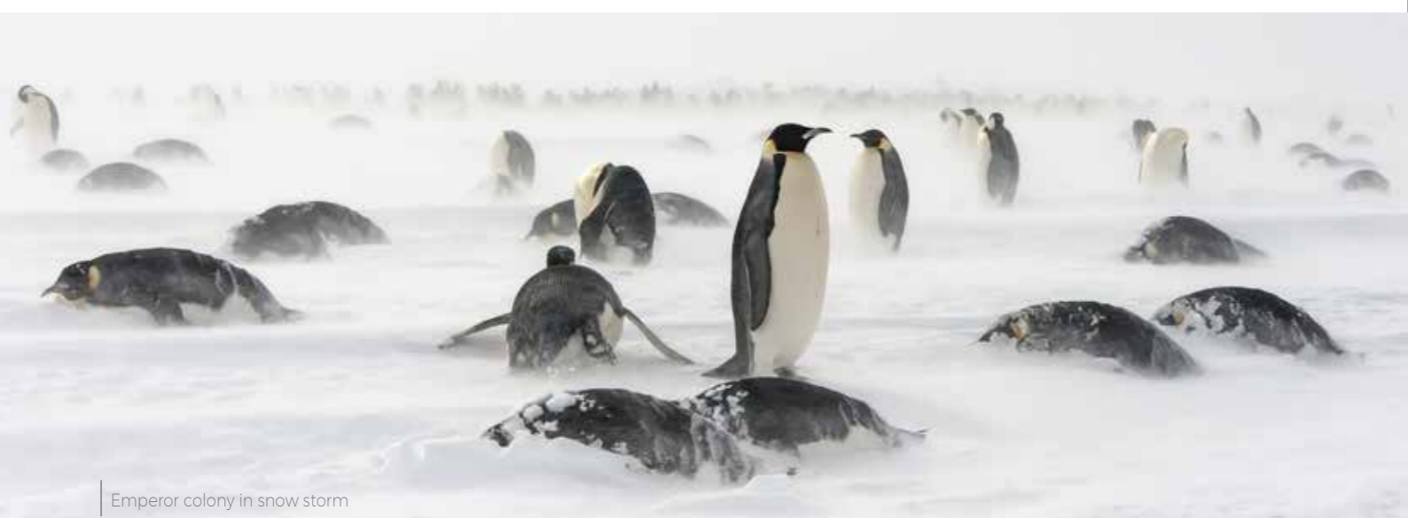
Emperor colony in snow storm