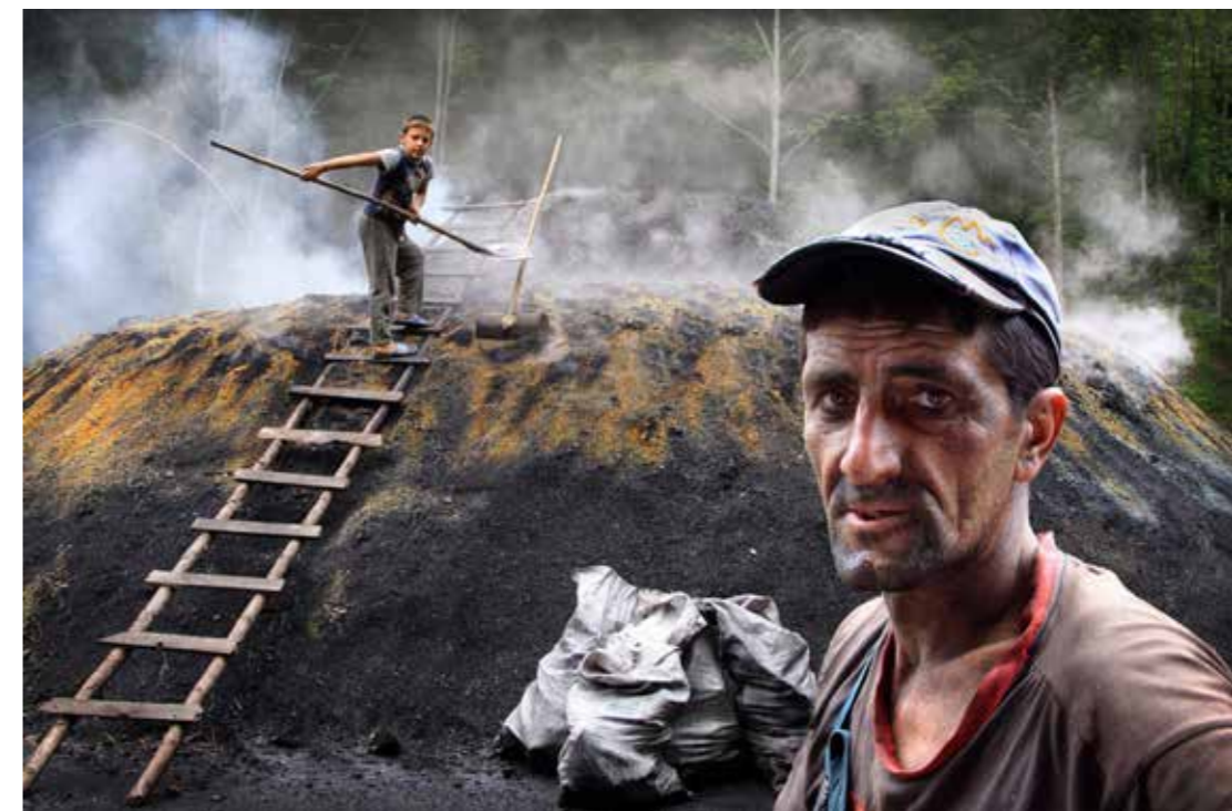
With my son