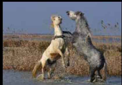
Andre Gertosio - Horse Fight