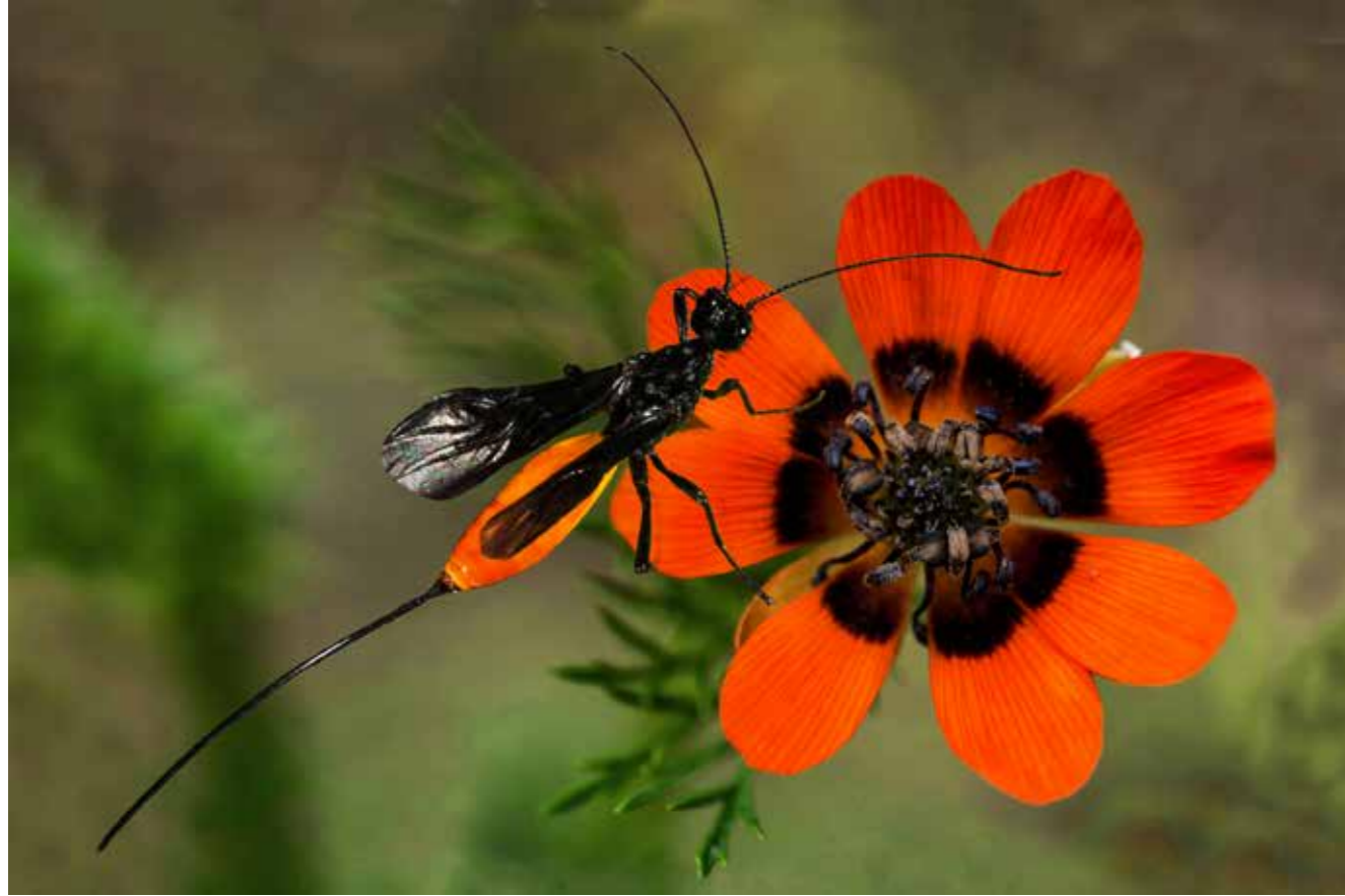
Ichneumon sur adonis (Var)