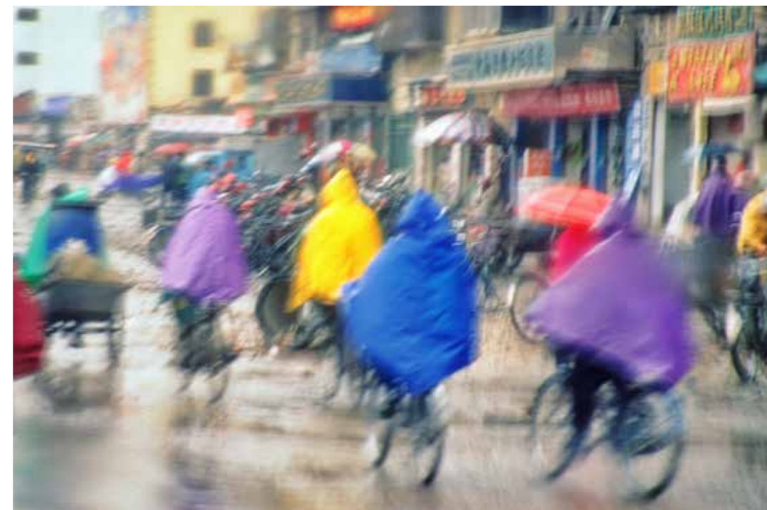
Monique Corriol Pluie (Guilin)