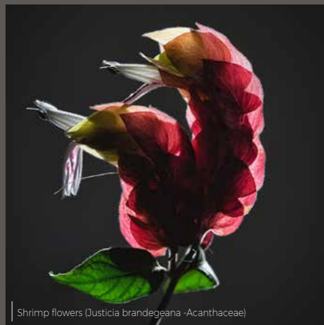
Shrimp flowers (Justicia brandegeana -Acanthaceae)