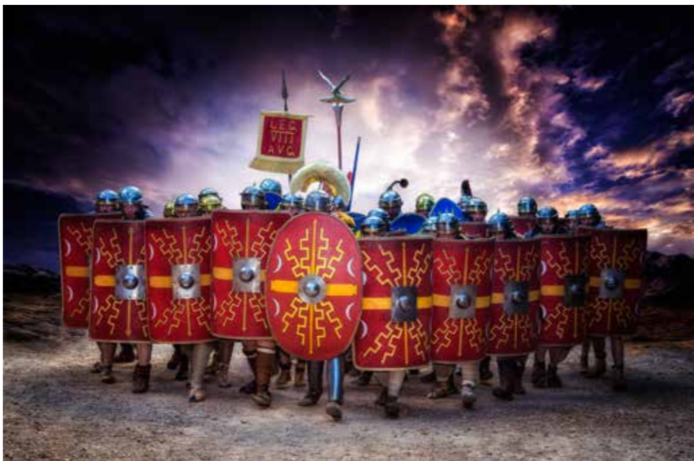
Alain Gaynard Face à la légion romaine