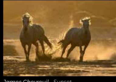
James Chevreuil - Sunset