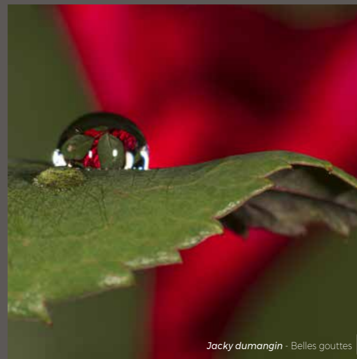
Jacky dumangin - Belles gouttes