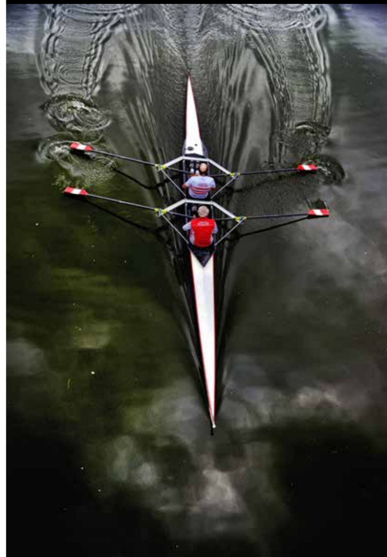
Bekir Yesiltas - Blacksea