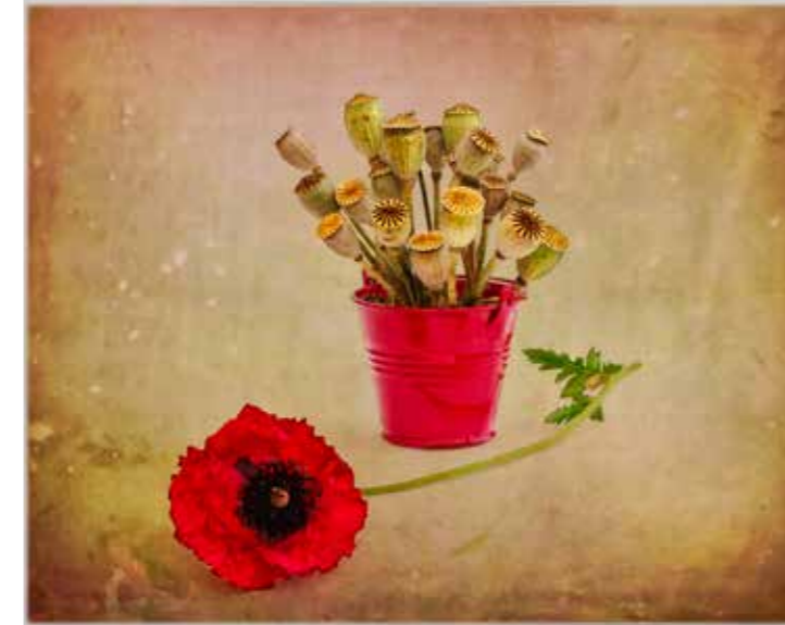
Petit seau rouge et coquelicot