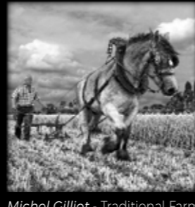
Michel Gilliot - Traditional Farming