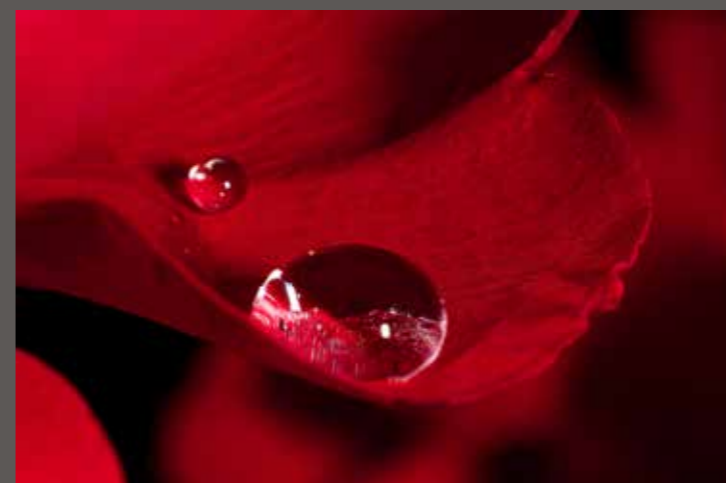
Jacky dumangin - Equilibre