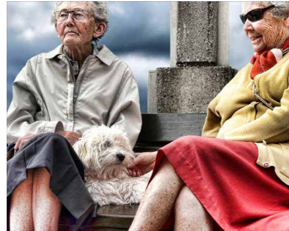
2 vieilles et 1 chien