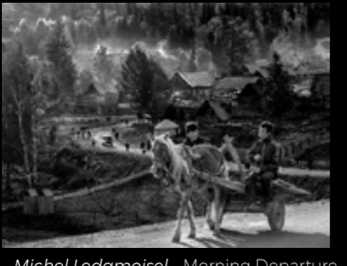
Michel Ledamoisel - Morning Departure