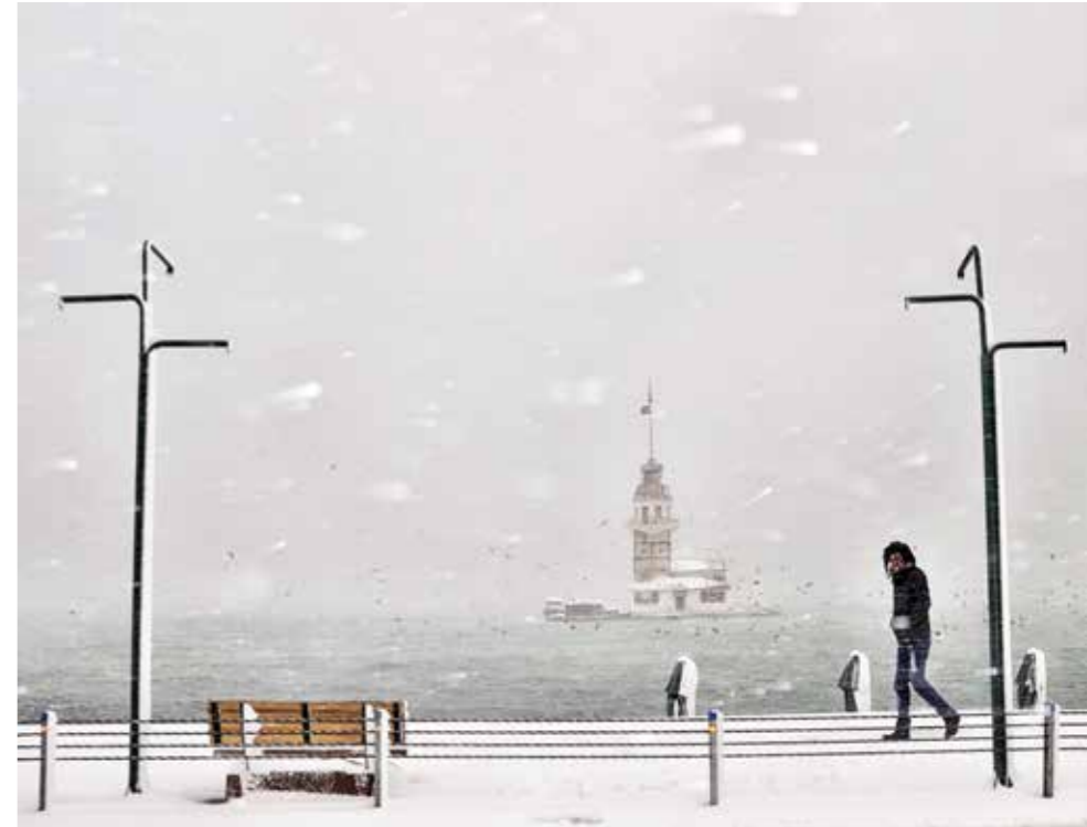
Bekir Yesiltas - Blackwinter