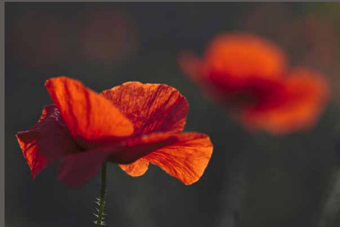
Alain Paillé - Nous voulons des coquelicots