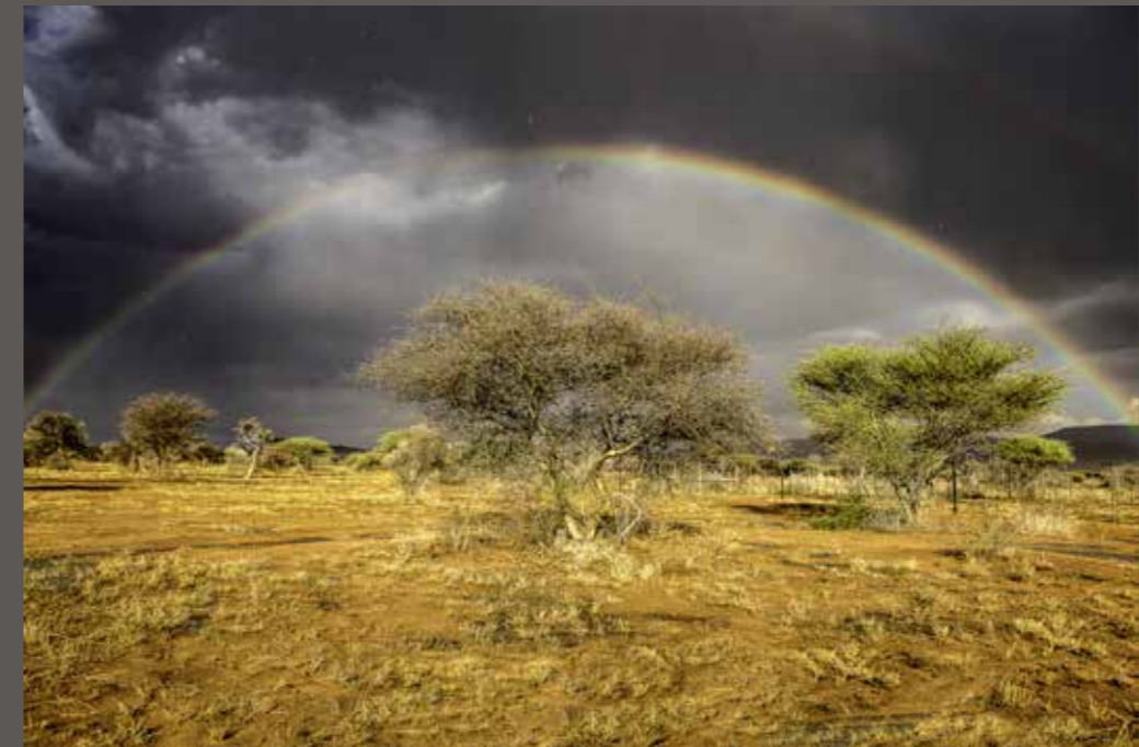
Nelly Degreave - Arc en ciel