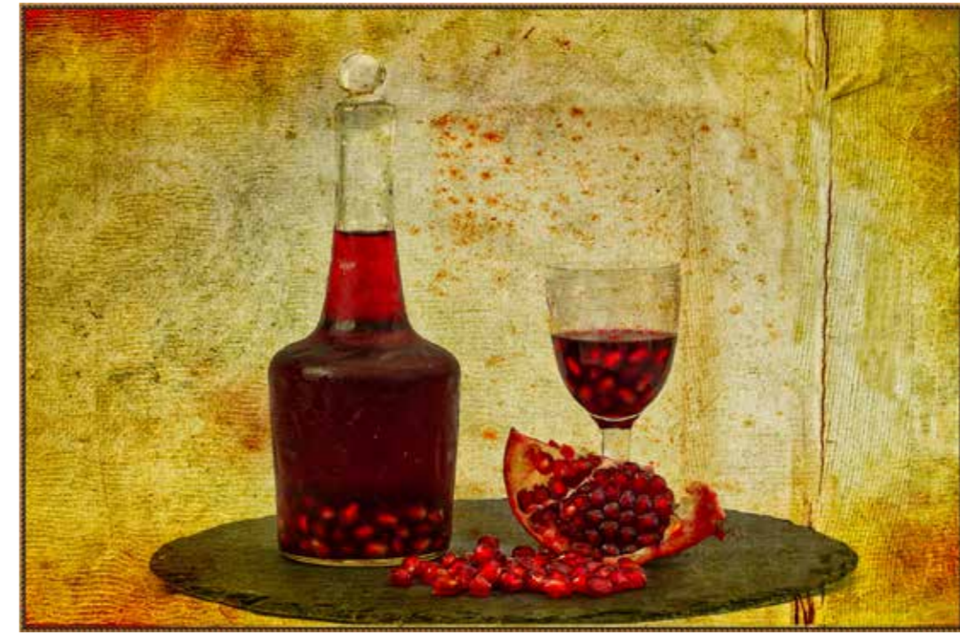
Vin de grenade