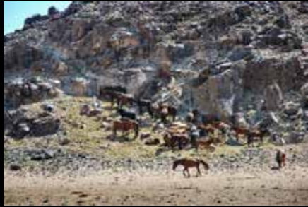
Monique Corriol - Altai (Mongolia)