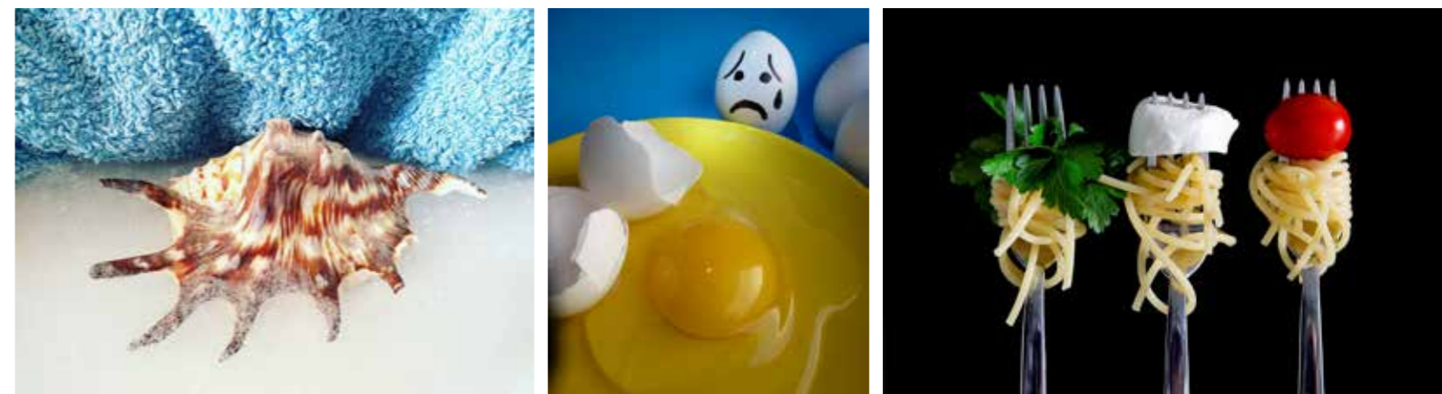
Pamela Cerritelli - Tema souvenir

Image Sans Frontière a relayé largement l'information sur sa page Facebook afin d'informer un maximum de photographes. Pour soutenir cette initiative, Image Sans Frontière a attribué une médaille d'Or qui sera décernée à une des meilleures images de cette compétition.