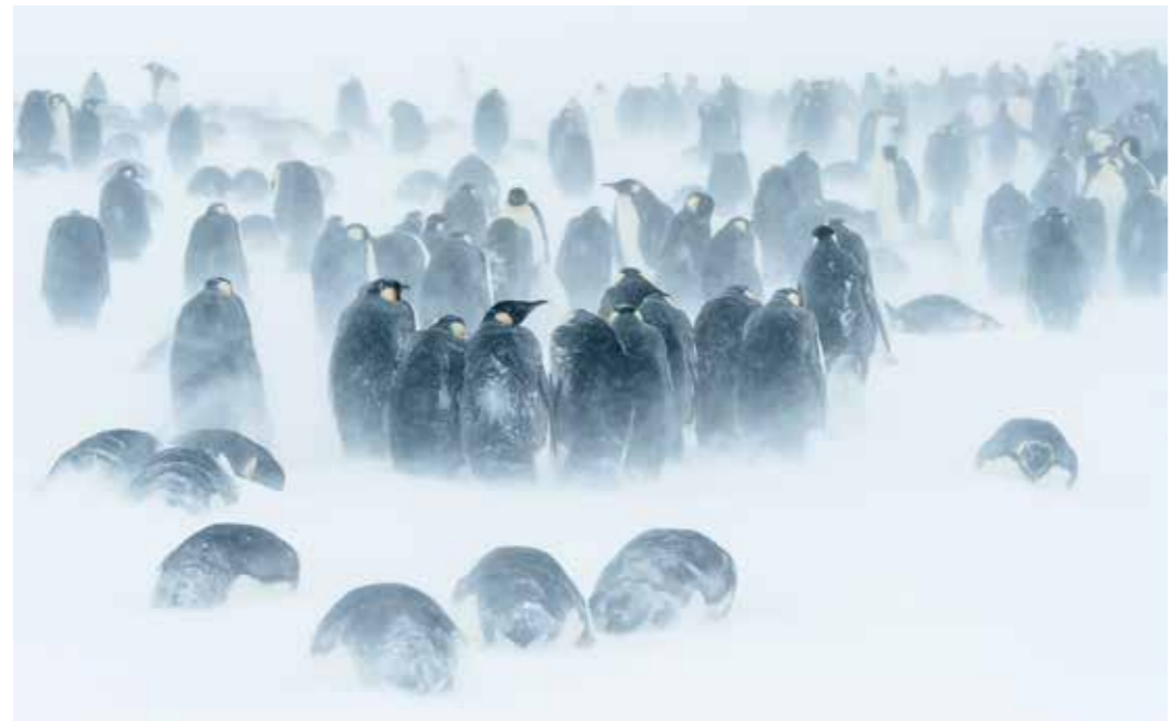
Emperor colony in snow storm