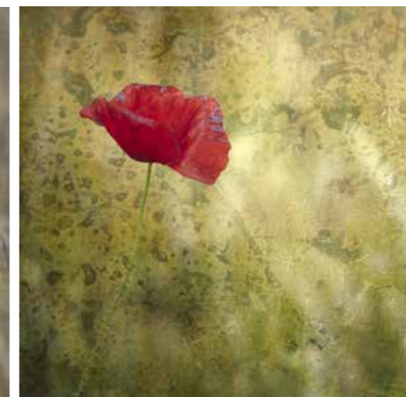
Sophie Turlure Chabanon - Coquelicot rouillé