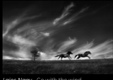
Lajos Nagy - Go with the wind