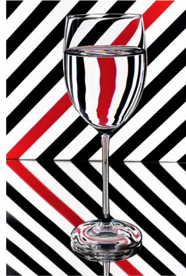
Urs Albrecht - Glas GT