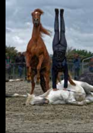
Sylvie Tachot-Goavec Freedom