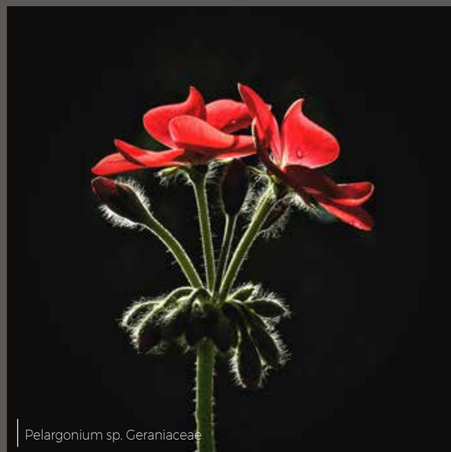
Pelargonium sp. Geraniaceae