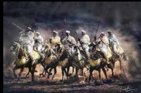
Gerard Bayssiere - Sorba