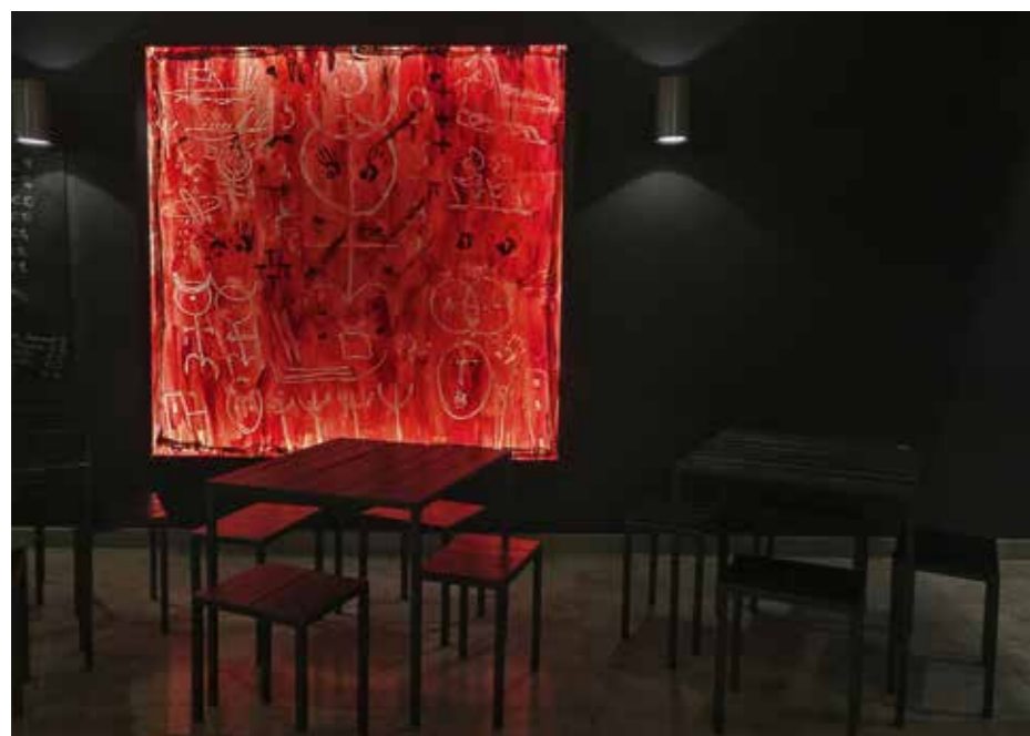
Guisi Giublena - Italy / Interno