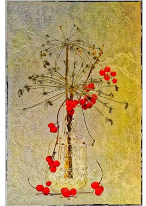
Ombelles et Bryone