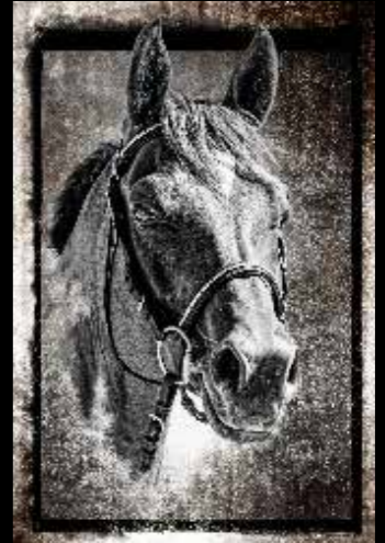
Alain Gaymard - Portrait