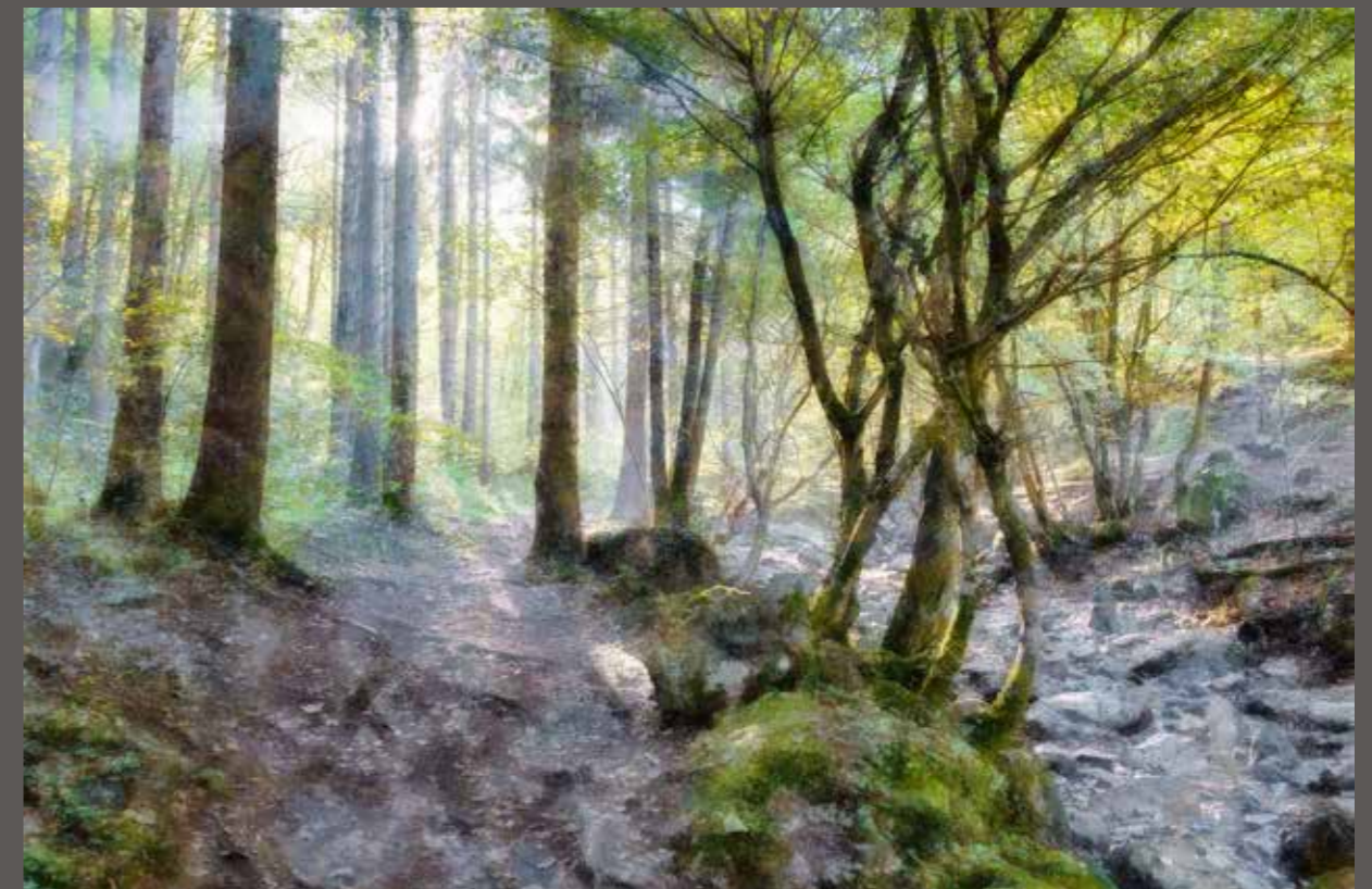
Vallée du Ninglinspo