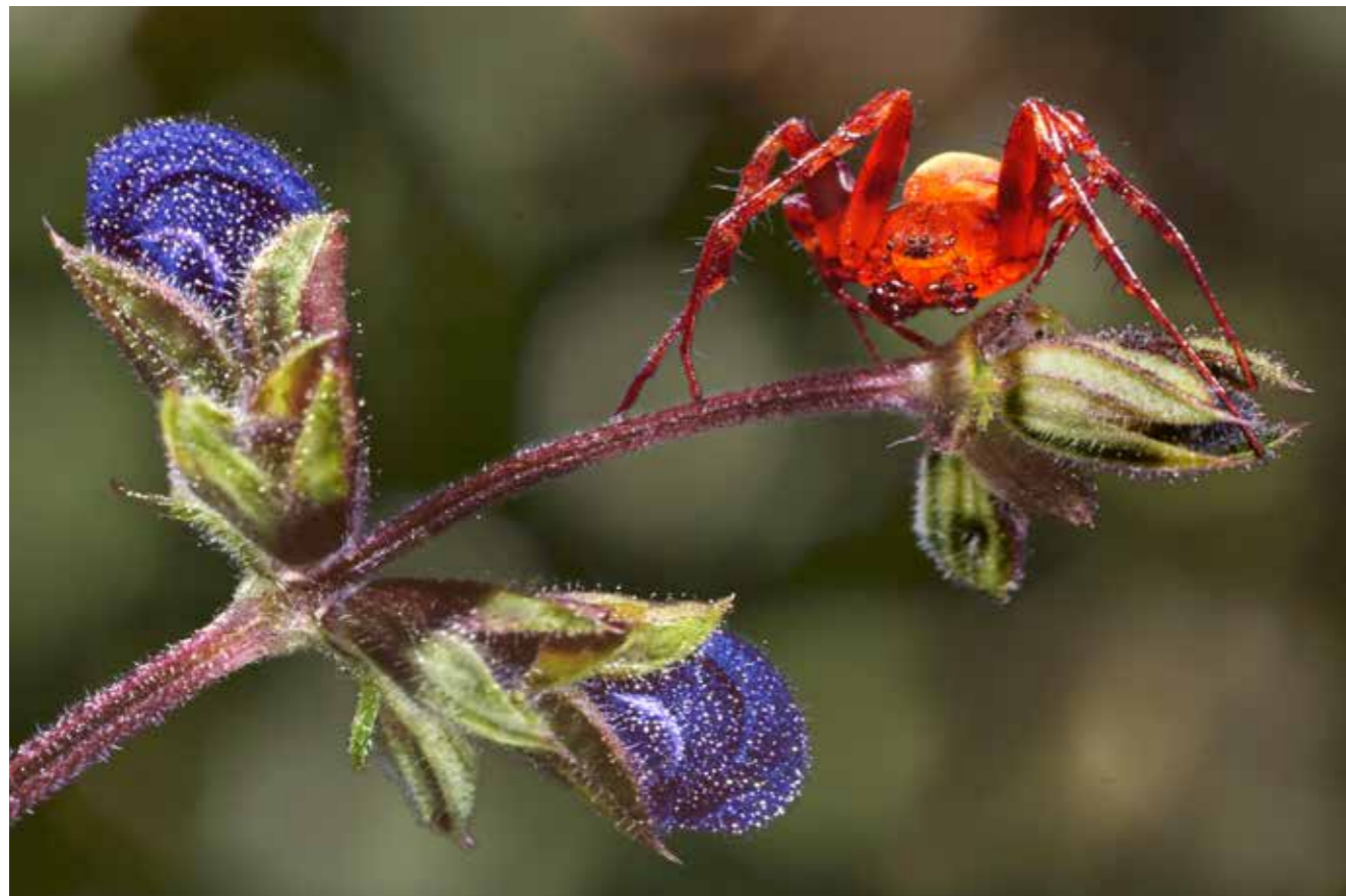
Araignée rouge (Hautes Alpes)