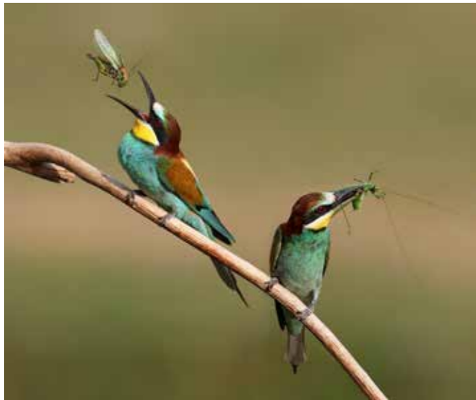
Bee eaters with grasshoppers

Il a travaillé en photographie analogique, mais depuis 1993, il ne prend plus que des images numériques. Ses intérêts en matière de photographie sont vastes et variés : paysages, personnes et lieux, nature et voyages, photographie altérée, mais il aime aussi le photojournalisme. Sa devise "Voir et montrer" - saisir l'instant et présenter le sentiment de l'instant à travers les images.